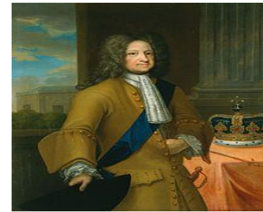
Robert Walpole Prime Minister