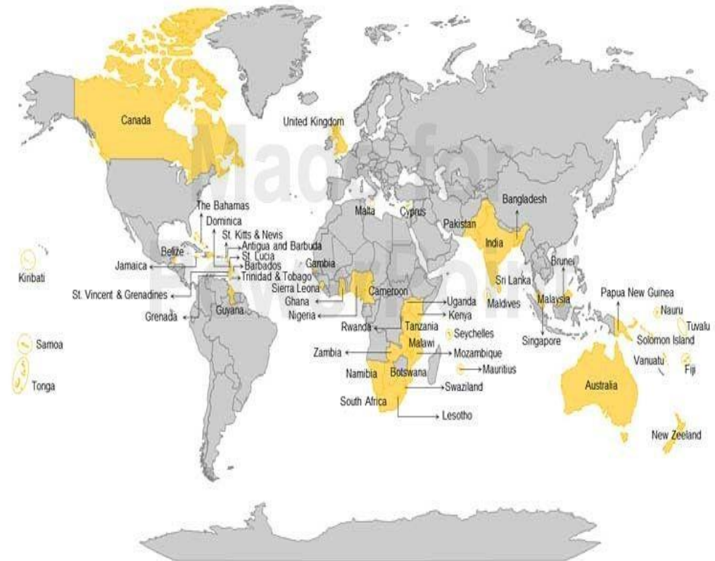
Commonwealth Countries Map Countries